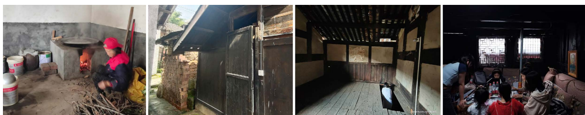
Figure 4. Photos of the kitchen, toilet, staircase opening, and living room

楼下村传统民居中厨房炊具主要包括砖砌灶台与操作台、橱柜、水缸米缸等, 柴火垛放置在墙角或简易阁楼上(见图 4)。厨房开窗面积通常较小, 没有配置吸油烟机导致墙体长时间受烟气影响挂满油污, 采光不足, 空气流通不畅, 影响烹饪。木质地面易脏乱潮湿, 滋生细菌。卫生间(见图 4), 几乎为旱厕, 开窗位置较高且开口小, 通风效果欠佳。同时厕所蹲位底下直接连通堆粪池, 易招引蚊虫及滋生细菌。池内粪污做天然肥料浇灌菜园, 虽然能够间接产生经济价值, 但使用起来舒适度较差。平衡使用舒适度提升与旱厕堆肥价值实现, 是楼下村传统民居适应性更新当中的重要一步[13]。楼下村传统民居维护结构均为木材, 结构较薄, 不便铺设电路管道, 电线多直接暴露固定在天花板、墙体上, 存在较大安全隐患。楼下村传统民居中首层净高通常为 2.5~2.8 米, 天花板为轻质木板固定在木横梁上, 分割出上部空间作阁楼, 在堂屋或卧室位置开约 0.6 \times 1.5 米的洞口(见图 4), 在首层架简易木爬梯承担竖向交通功能, 上下楼不便且存在安全隐患[17]。