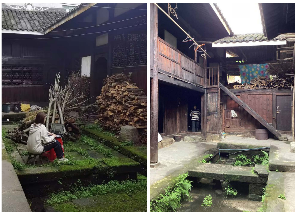
Figure 2. Photo of the traditional courtyard of the louxia village 图 2. 楼下村传统合院照片

民居的宅院空间包括建筑组群围合而成的内部庭院与建筑外附属空地两部分空间形态, 除了加强采光通风, 还有晾晒农作物、衣物外、聚会、交谈等功能。实地调查发现, 当地民居宅院下界面主要有夯土、混凝土、砖石三种材料, 布置简单(见图 2)。由于民居老旧及长时间闲置, 多数宅院地面布满青苔与野草, 环境质量较差。另外居民常在宅院内蓄养饲养家禽, 排泄物的不及时清理易滋生病菌和散发气味导致宅院环境质量较差[17]。