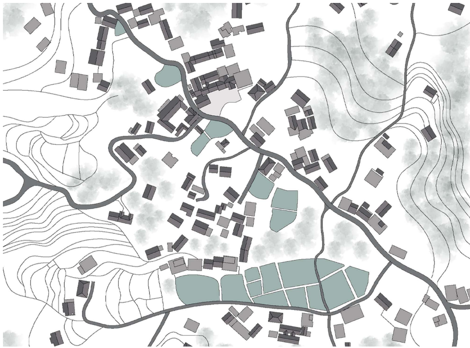
Figure 1. Building distribution map of louxia village