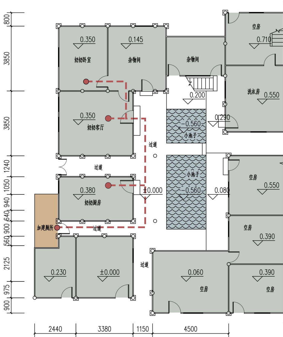
Figure 3. Streamline diagram of the local plan of the courtyard 图 3. 合院局部流线图

不如厅[19], 又因为木墙年久表面呈灰黑色, 室内阴暗狭小且私密性较差。餐厅在传统民居中通常不会单独设置, 常为客厅的附属功能[20]。多数客厅与厨房距离较远, 因此就餐距离较远, 甚至经过室外檐廊, 交通流线不畅。同样, 卫生间多为旱厕且远离卧室等主要功能房间, 常单独设置在主体建筑两侧或后院, 使用不便, 尤其是在夜间。以图 4 某合院局部平面图为例, 卫生间为加建砖墙小室布置在西南角, 与奶奶卧室间距约 15 米, 途径室外檐廊(见图 3)给老年人的使用尤其是在雨季或寒冷季节带来麻烦。