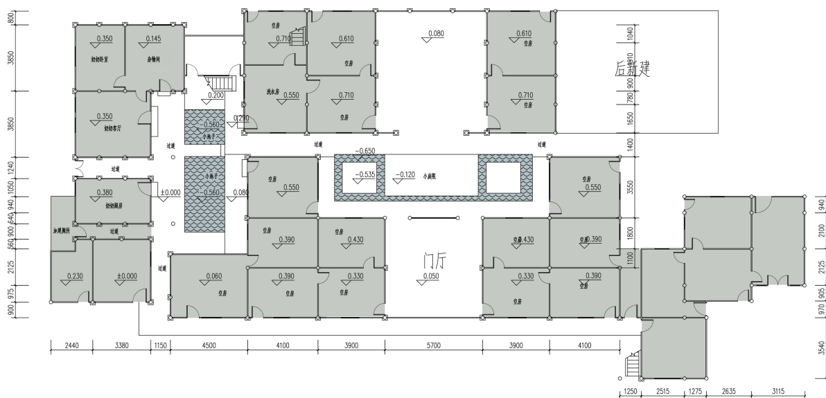
Figure 6. Ground floor plan of the courtyard in Louxia village 图 6. 楼下村某合院首层平面图