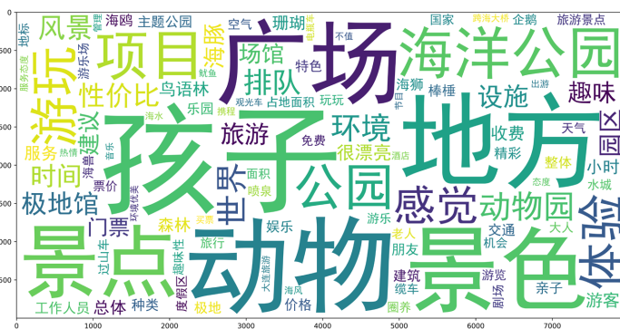
Figure 1. Hot word cloud distribution of Dalian tourism 图 1. 大连市旅游热词词云分布