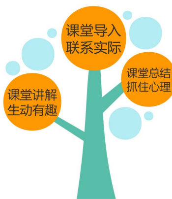
Figure 3. Classroom requirements 图3. 课堂要求

基于本文上一部分对学生、教材等的分析以及对授课过程注意事项与突出点的强调, 笔者将针对《导游基础》中具体的民族民俗这一节设计相关教学内容, 力求使教学细节更加清晰明了。课堂中应有要求如图3所示, 基于此设计的“指导-自主”教学法在民族民俗讲解中的应用如图4所示。