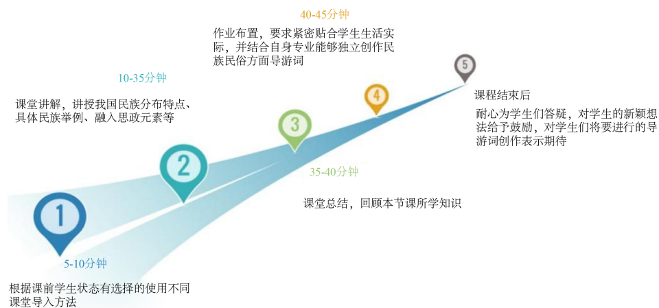
Figure 2. Class time arrangement of Ethnic Folk courses