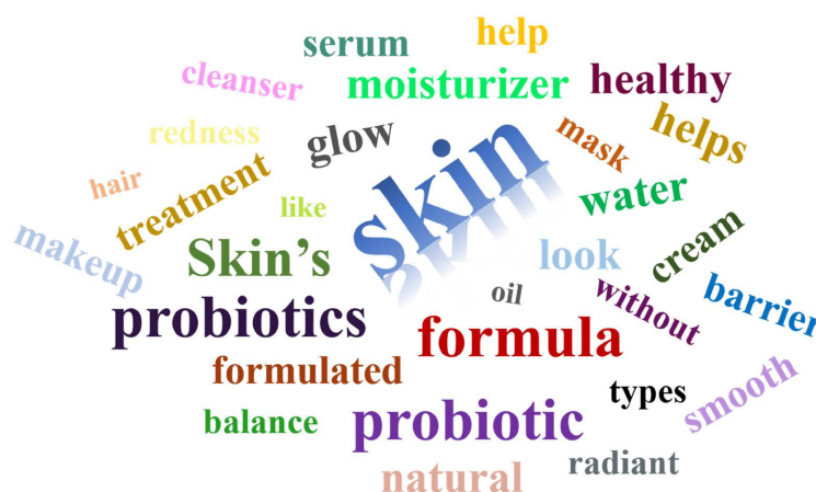
Figure 1. The top 30 words used in the claims of cosmetics marketed as probiotics

由于益生菌/后生元这一概念拥有巨大的商业价值，导致某些专注皮肤护理的化妆品企业进入该产品生产领域，从而为其带来丰厚利润。如果产品标识上没有给出详细的菌株名称等信息，使用者将无法对该产品中的益生菌/后生元成分做出相应的功能评判。此外，许多产品中包含的是一些益生菌提取物、酵素或者菌体裂解物等，这些产品中并不含有活菌，而是符合后生元范畴，因此在产品宣传时不应写益生菌等字样。在美国市场目前至少有 50 种声称含有益生菌的产品已经商业化[2]，这些商品在介绍里常用的 30 中术语如图 1 所示，其中大多数是护肤品、除臭剂和护发品；此外，在产品功效说明中“平衡”皮肤微生物群，改善皮肤屏障，增强皮肤的整体外观成为最常见的说法。