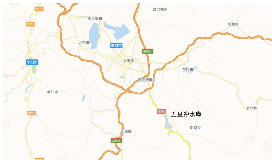
Figure 1. Location of the Five Mile Chong Reservoir

五里冲水库(图 1)，是云南省重点水利工程之一，自 1991 年 10 月开始启动。水库设计库容为 7949 万 m 3 ，灌溉面积达 10 万亩，在一年范围内它供应了 1500 万立方米余的居民生活和工业用水。五里冲水库目前是蒙自最大的一个水库，它是蒙自——云南滇南部中心城市的重要供水源，供水范畴主要包含蒙自新、老城区周边及大屯镇、雨过铺镇一带。