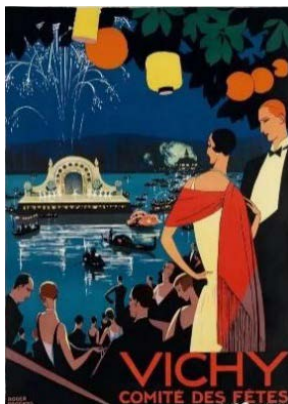
Figure 6. “Vichy Comite des Fetes” 图 6.《维希旅游海报》 ③

和装饰效果，常用金属色、对比色以及黑白原色，色彩明快，具有极强的现代感，这一时期海报设计中的女性形象同样如此。如罗杰·布洛德斯在 1920 年代绘制的法国维希旅游海报(如图 6)，运用强烈的冷暖色彩对比展现了维希繁华的夜生活，占海报主体位置的女性形象色彩鲜艳饱满，暖黄色的长裙外披一条鲜亮的红色围巾，与深蓝的背景形成强烈对比，更凸显女性优雅温暖的气质以及维希的繁华浪漫。艺术表现形式上采用的是平涂色彩的方式，没有多余亮面暗面来凸显物体的立体感，仅仅通过远近大小以及色彩冷暖来展现画面纵深。瑞典设计师莫吉·阿斯隆德为派拉蒙电影《波莱罗》设计的宣传海报的用色则相对淡雅，海报中男女主角跳着探戈舞，虽然色彩对比度不高，但是简单的平涂色彩加上流畅利落的色块却精准地描绘了舞姿的动态，画面中唯一的抓人眼球的红色用于电影名称的花体字，既起到了装饰海报的作用，又传达了电影海报的有效信息。