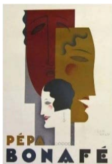
Figure 7. “Pepa Bonafe” 图 7.《佩帕伯娜菲》 ③

装饰艺术运动时期的海报设计大量吸收了现代主义及立体主义的艺术表现语言，因而海报设计中常会将女性形象的特征进行抽象化处理，以简化的几何形状代替真实的人体特征，这种抽象化的特征突出了女性特点、表现了特定的情感或意义。让·卡卢 1928 年为法国女演员佩帕·伯娜菲绘制的海报(如图 7)非常有代表性。通过抽象的几何和高对比度的色彩描绘了女演员的两幅侧影头像和一张正面头像，演员的五官被让·卡卢简化成了抽象的几何形状：椭圆形状代表眼睛，渐变色彩的圆形代表腮红，修长的脖子直接简化成矩形，不规则的波浪图形则是头发的象征，具有立体主义象征性意味的图形极具设计效果，展现了神秘优雅美丽的女性气质，兼具现代感与时代感。