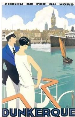
Figure 3. “Dunkerque” 图 3.《敦刻尔克》 ③

女性形象，是各个时代艺术家热衷表现的对象与主题，19世纪末是妇女解放运动的第一次浪潮，孕育了时代的新女性，女性题材的流行成为了必然[2]。20世纪20、30年代，随着社会经济的发展，女性更广泛地参与到社会生产中去，装饰艺术运动时期的女性社会地位相对于从前有了更多的提升，这一时期的海报虽然强调简单的线条和结构分明的几何图形，不同于新艺术运动时期柔美的自然主义女性化风格，但也不乏女性形象出现在海报设计中，大多数为旅游海报、电影海报、舞台剧海报以及杂志封面海报，而这些海报中的女性形象又可大致分为以下几类。