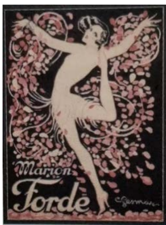
Figure 4. “Marian Forde” 图 4. 《玛丽安·福德演出海报》 ④

20 世纪 20 年代, 欧洲美国的经济繁荣发展, 人们不仅满足于丰衣足食的生活需求, 更追求娱乐文化带来的精神享受, 20 世纪初期, 舞台剧、电影娱乐风靡一时, 与之相对应的娱乐宣传海报也层出不穷, 这一类海报作品通常是以性感美丽的舞台剧明星或演员为主角的。如 20 世纪初巴黎最著名的舞台服装和演出海报设计师查尔斯·盖斯玛, 他虽然在风华正茂的时候就不幸因肺炎去世, 但是他留下的大量设计作品成为法国“装饰艺术”运动的重要成果。盖斯玛的客户名单包括了几乎当时所有巴黎知名的演艺女星。这位才思敏捷的设计师, 似乎有永远用不完的新点子, 在他的手中, 色彩也变得炽热多情[3]。他为玛丽安·福德绘制的演出海报(如图 4)极好地体现了他独特的风格——构图新颖, 用色鲜艳, 海报以这位演员为主体, 姿势活泼大胆, 周身围绕着艳丽的花瓣。在他的舞台剧海报中, 女性形象尤其美丽大胆、华丽精致, 舞姿极具戏剧张力, 非常吸引观众目光, 达到了极好的商业宣传目的。