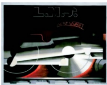
Figure 1. “L.M.S Best Way” 图 1. 《L.M.S 最好的铁轨》 ①